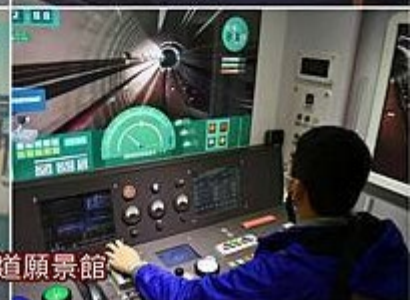
阿發的簡單幸福【桃園市桃園】桃園軌道願景館